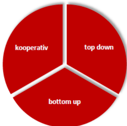
Ansätze zur Projektrealisierung

Die einzelnen Umsetzungsphasen sind auf drei Jahre ausgelegt (2019–21, 2022–25, ...). Vor jeder Umsetzungsphase werden Handlungsschwerpunkte festgelegt, geeignete Projekte und Massnahmen geprüft und ausgewählt. Vorhaben der vorangehenden Phase mit längerem Umsetzungszeitraum werden nach Validierung ins Projektportfolio der aktuellen Umsetzungsphase übernommen.